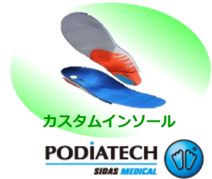
カスタムインソール