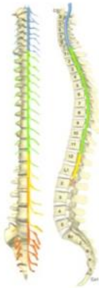
NFC カイロプラクティック